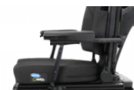
Ap. Braço Reclinável