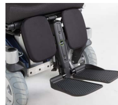
Ap. Pernas Central Elétrico LNX