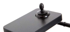
2233 + 2241